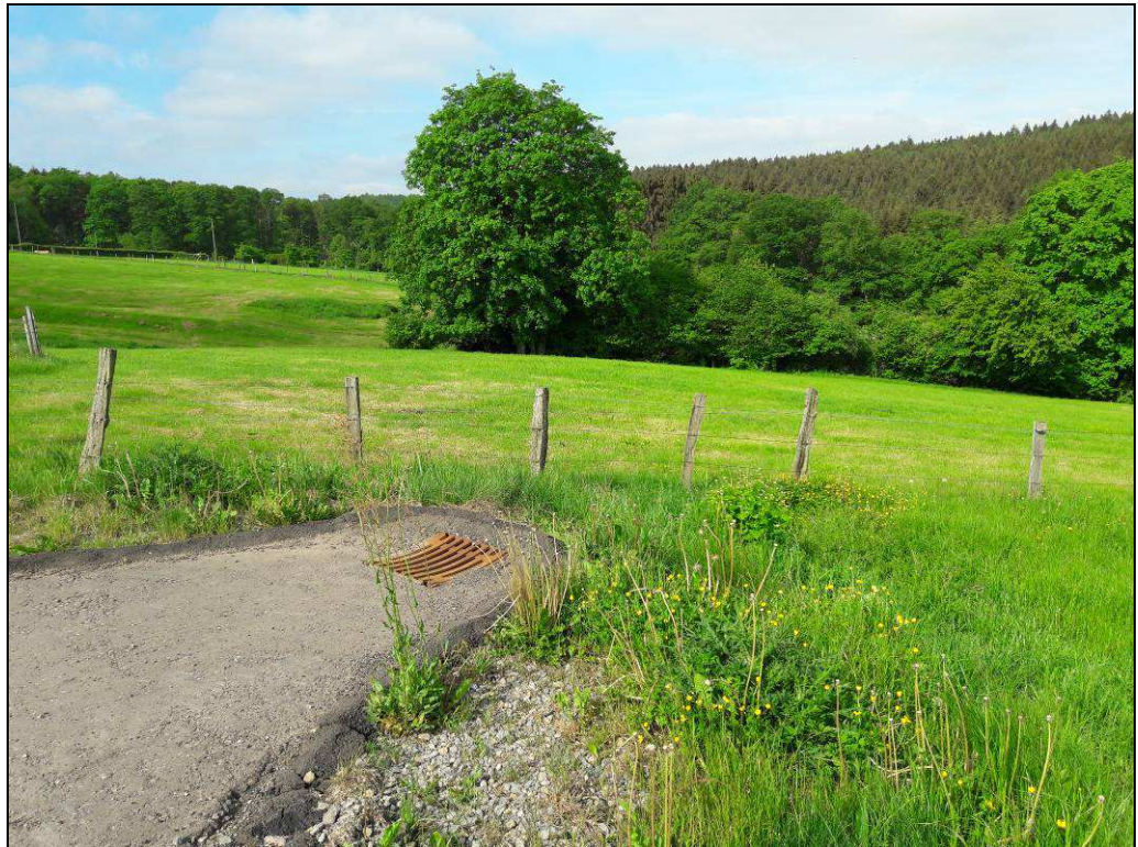
Foto 1: Intensiv genutzte Mähweiden prägen das Plangebiet. Überblick des Plangebietes mit Blick Richtung Westen.