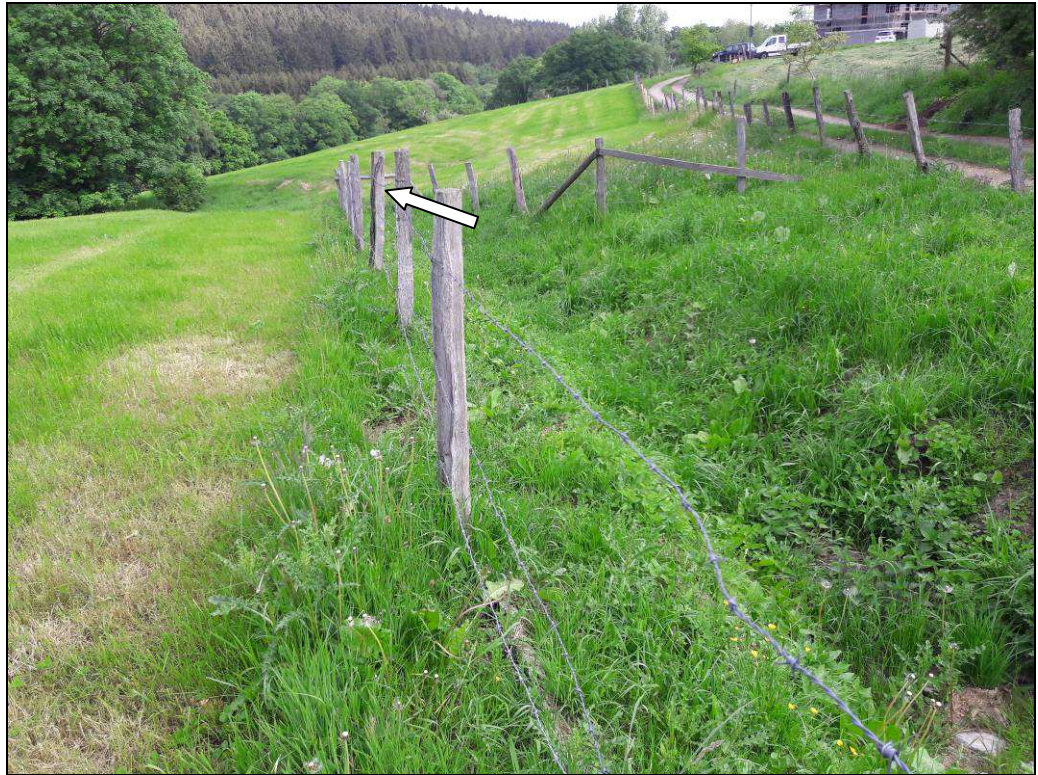
Foto 3: Graben mit steilem Trapezprofil in der Mitte des Plangebietes. Im Anschluss soll ein verrohrter Abschnitt wieder geöffnet werden (Pfeil).