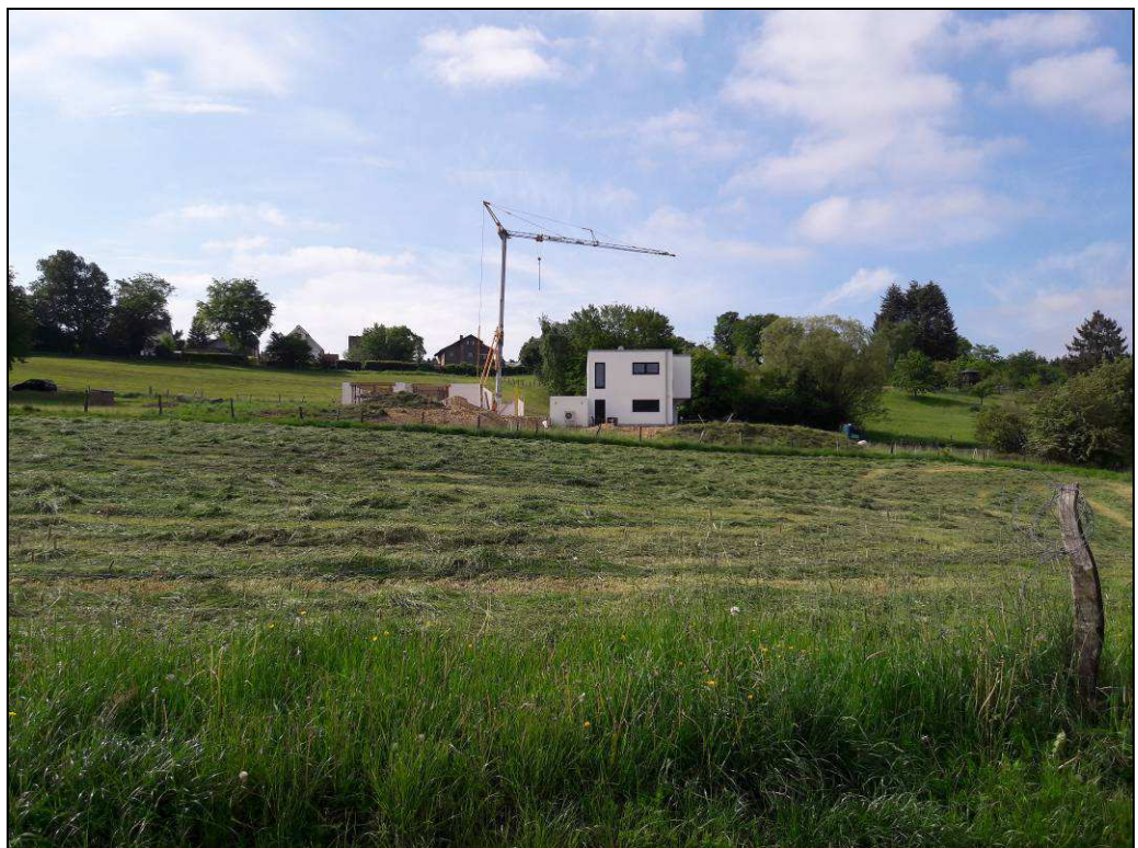
Foto 6: Überblick des Plangebietes mit Blick Richtung Süden auf bestehende und in Erweiterung befindliche Wohnbebauung.