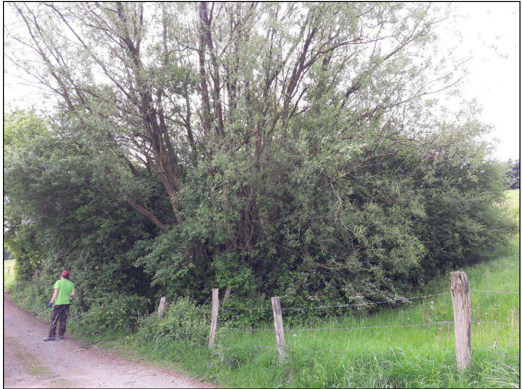
Foto 5: Feldgehölz am Ufer der Stillgewässer mit prägender Silberweide.