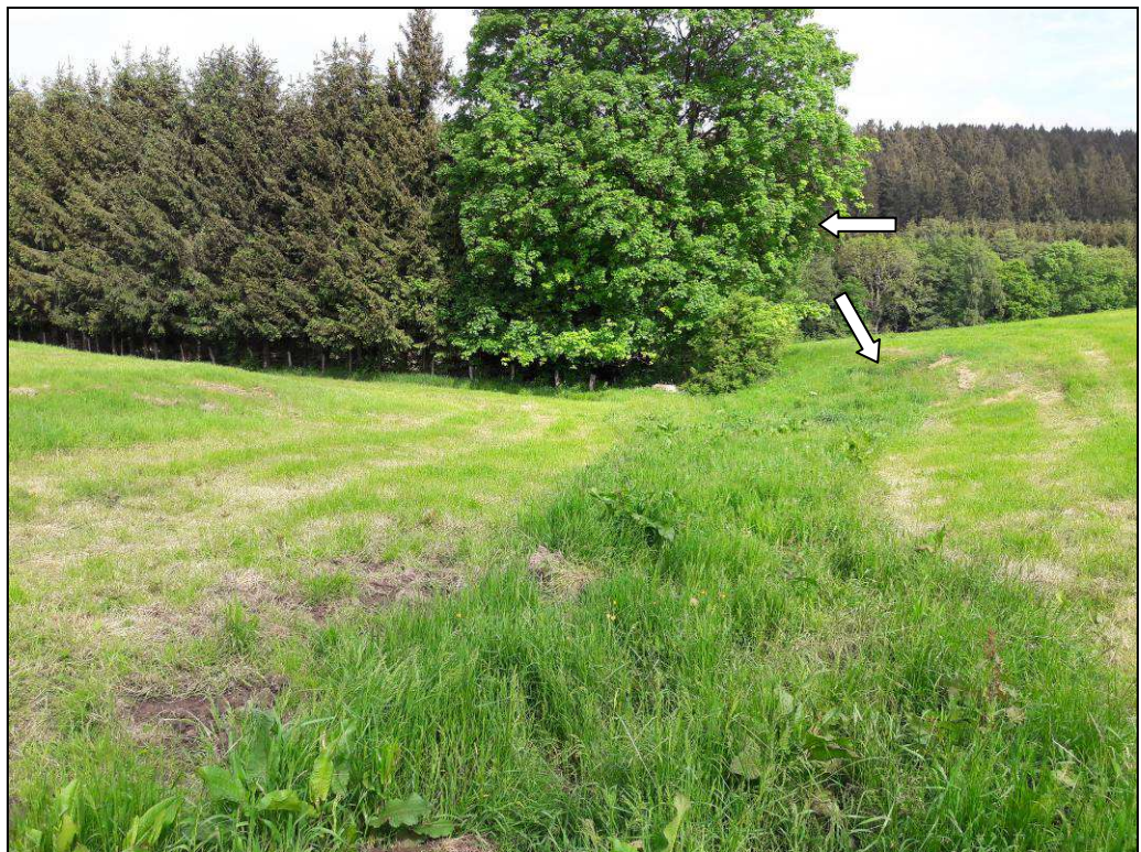
Foto 2: Kleinflächiges mageres Grünland auf Grabenböschung (Pfeil nach unten). Der Traufbereich der Ufergehölze reicht randlich in das Plangebiet.